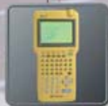
測量作業のデータ取得に欠かせないデータコレクタ