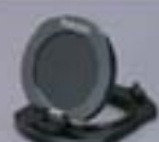
太陽観測フィルター8型