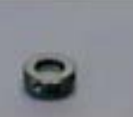
ソーラーレチクル6型