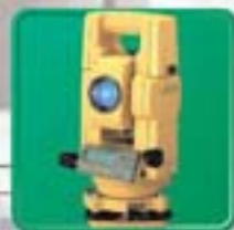
スペックアップしたトータルステーション

GPT-6000Cシリーズはデータコレクト機能と約5,000点という余裕のデータメモリ・さらに測量業から建設業まで幅広い作業をサポートする充実したアプリケーションプログラム、これら2つの機能を本体に標準で搭載し、価格は高いコストパフォーマンスを実現しました。