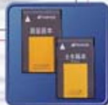
測量業・建設業と各種ユーザー様の作業に合ったアプリケーションプログラム