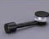
ダイヤゴナルアイピース10型